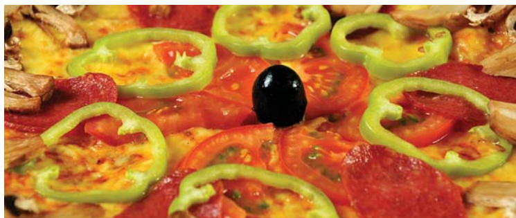
Пицца / PIZZA