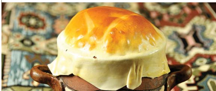
Супы | SOUPS