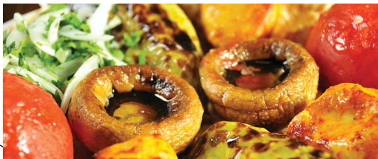
Горячие блюда | MAIN DISHES