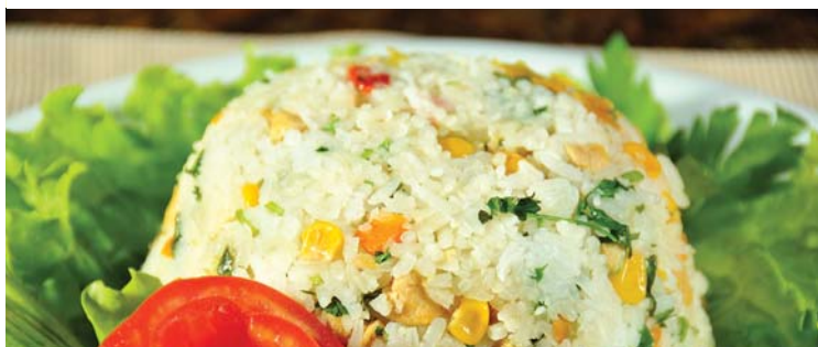
Салаты | SALADS