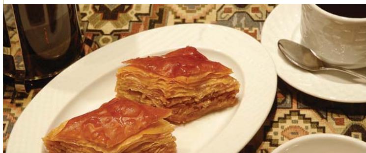
Десерт / DESSERT