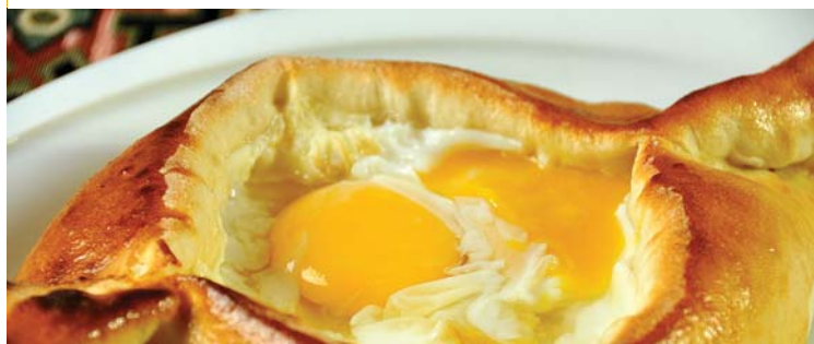
Хачапури / KHACHAPURI