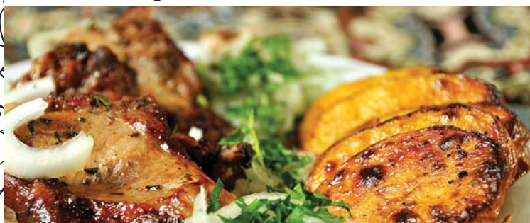
Шашлык | BARBECUE