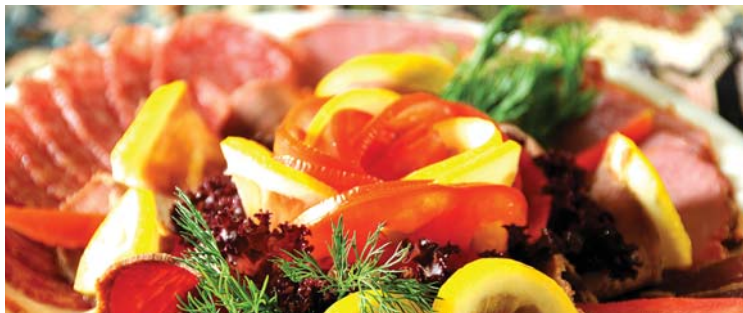
Холодные блюда | COLD APPETIZERS