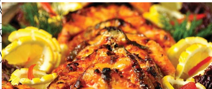
Рыбные блюда | FISH